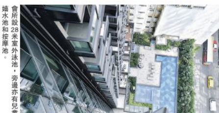
會所設28米室外泳池，旁邊亦有兒童嬉水池和按摩池。