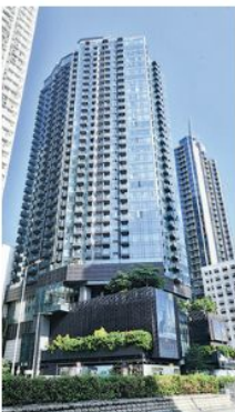
睿峰主打1房及2房戶，鄰近屋邨商場及民生小店，交通亦方便。