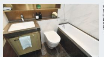
浴室配置浴缸，洗手盤上方亦附收納空間。