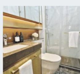
浴室配備巨型鏡櫃及企缸。