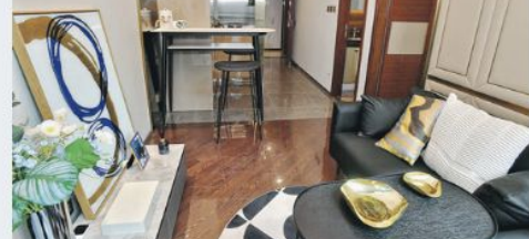
西翼25樓C室屬1房戶，開放式廚房呈曲尺形設計，設置高身型格吧檯。