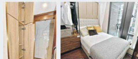
▲睡房連接工作平台，採光度不俗。