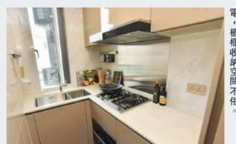
廚房呈曲尺形設計，配置名廠家電，櫃櫃收納空間不俗。