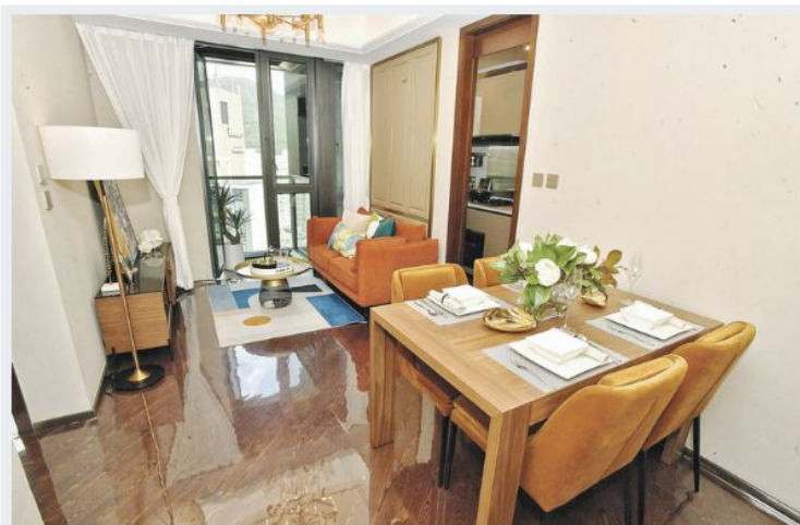
東翼25樓C室屬兩房硬廚設計，室內設計洋溢沉實古典的深褐色調。