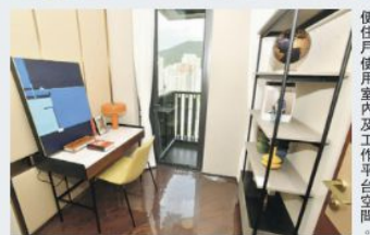
設計師把較細房間規劃為書房，方便住戶使用室內及工作平台空間。